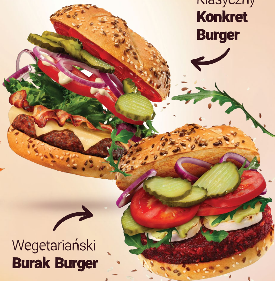
Wegetariański Burak Burger